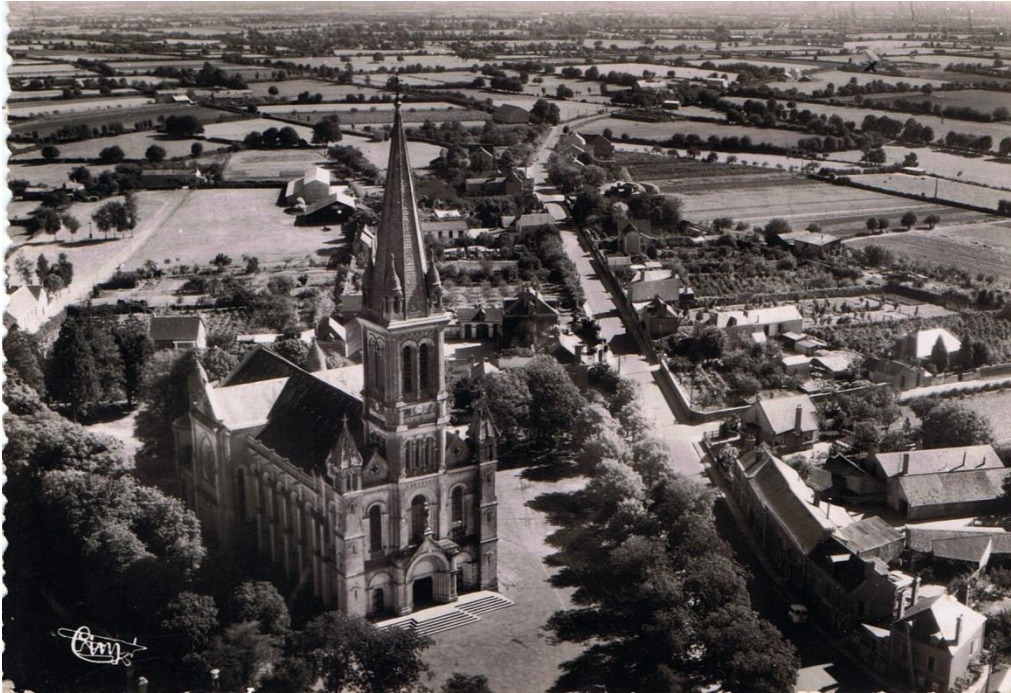
La route de Gonnord (Valanjou) avec les nombreux champs de culture

Les maisons de l'agglomération sont à proximité des champs de production. Les différents cours d'eau apportaient l'eau nécessaire pour les cultures.